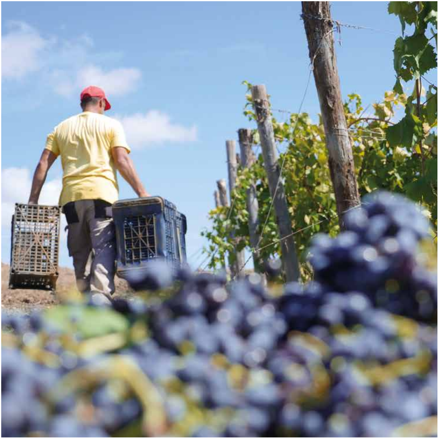
La vendemmia a Pattipiccolo, Alcamo Harvest in Pattipiccolo, Alcamo