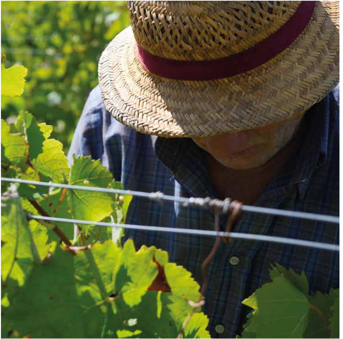
La vendemmia a Pattipiccolo, Alcamo Harvest in Pattipiccolo, Alcamo