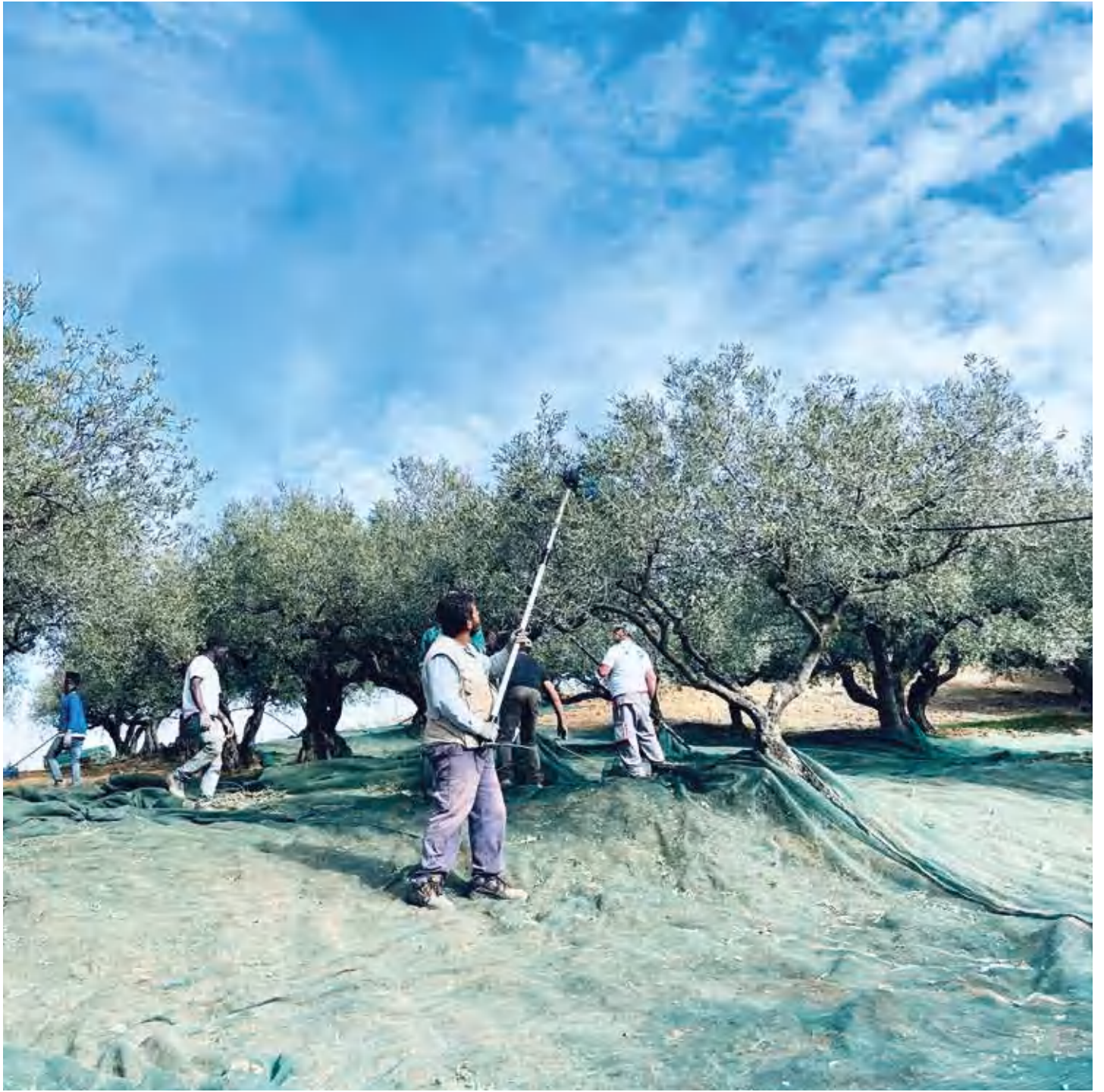
La raccolta delle olive a Pattipiccolo, Alcamo Olive harvest in Pattipiccolo, Alcamo