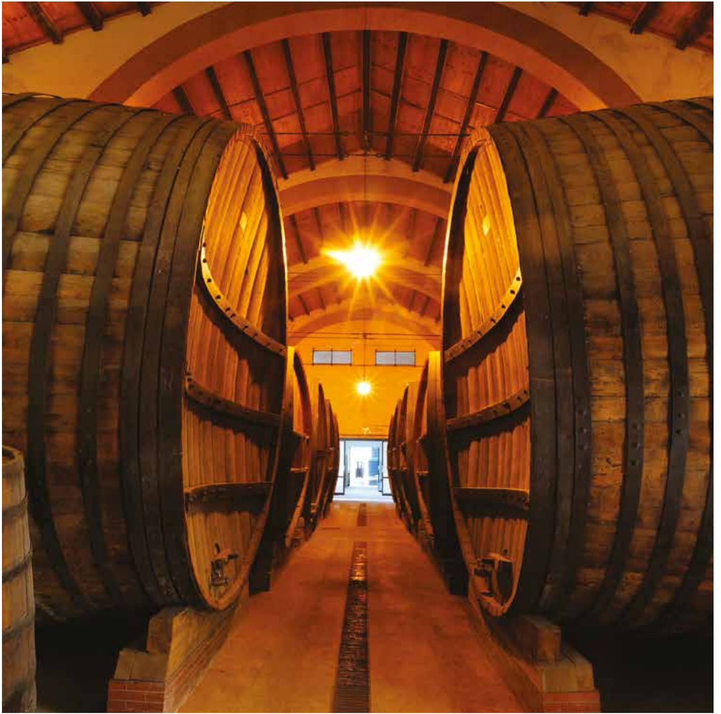
Bottaia storica, Marsala Historic barrels, Marsala