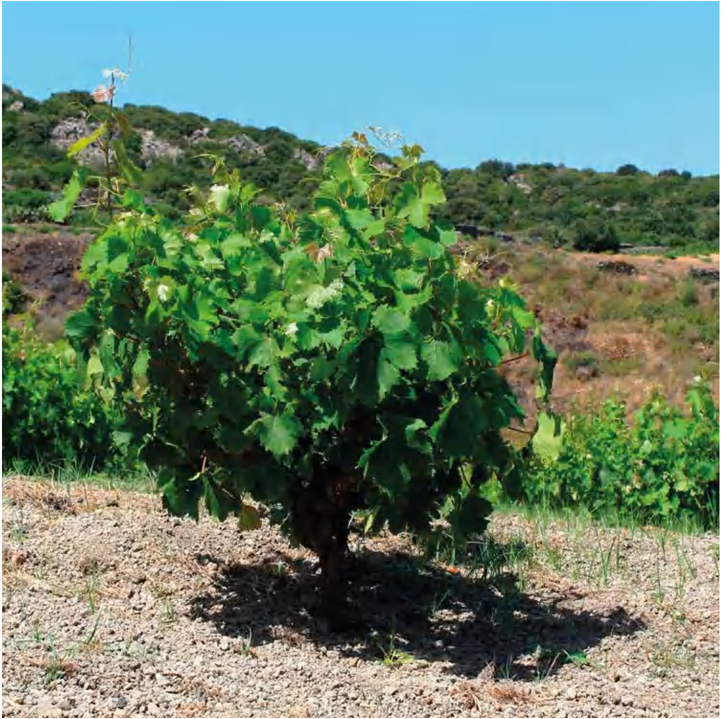
Alberello pantesco typical low bush customary of Pantelleria