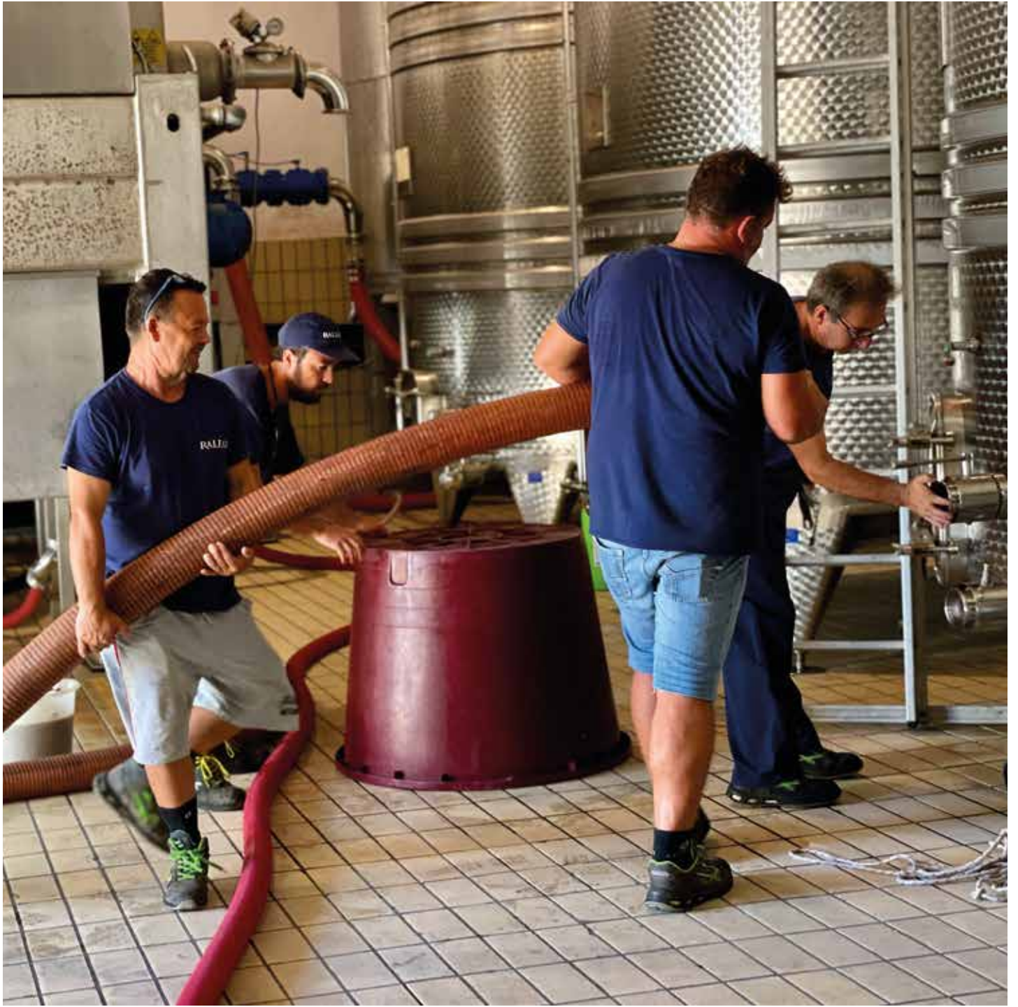
Uomini in Cantina, Marsala Men in the winery, Marsala