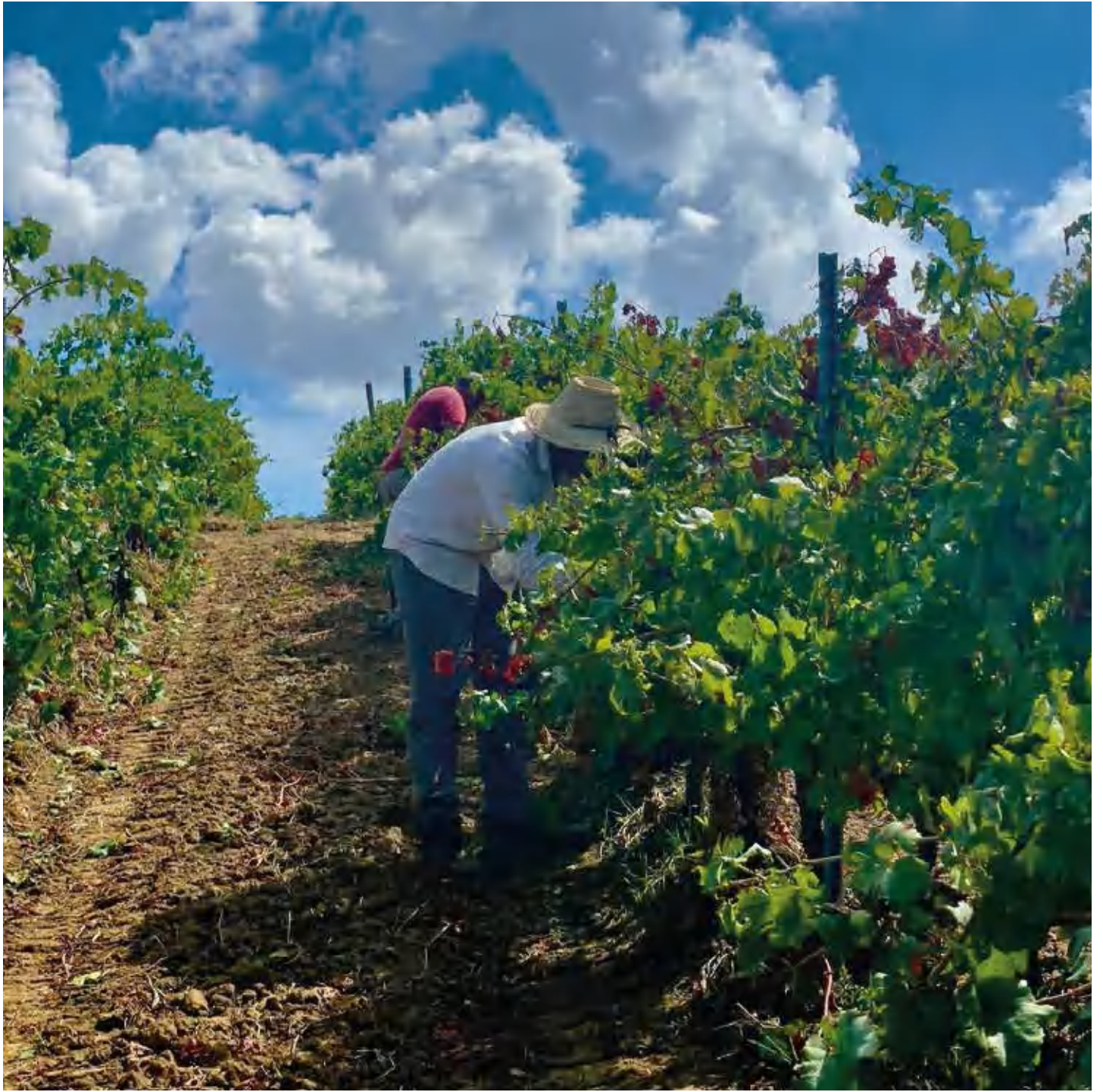
La vendemmia a Pattipiccolo, Alcamo Harvest in Pattipiccolo, Alcamo