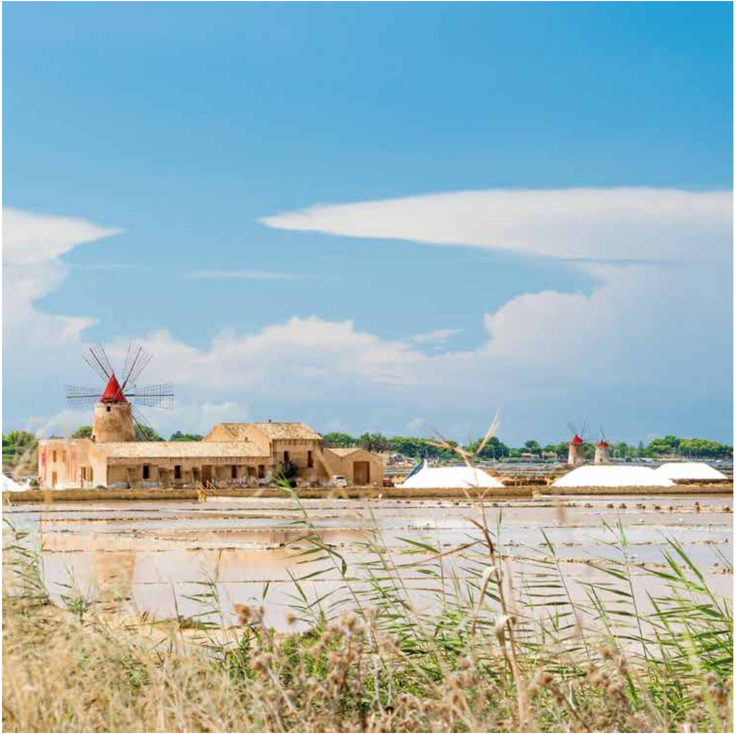
Le saline di Marsala The Marsala salt pans