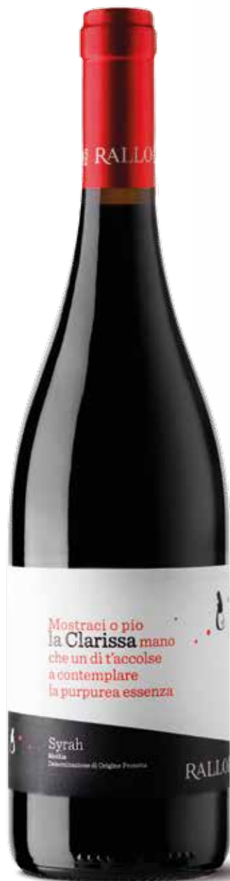
LA CLARISSA Syrah Bio Sicilia DOP / Pattipiccolo - Alcamo