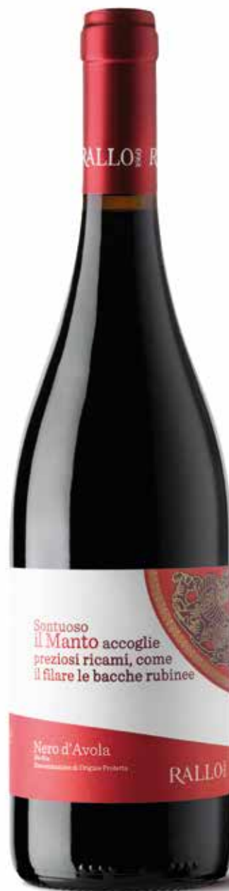
IL MANTO Nero d'Avola Bio Sicilia DOP / Pattipiccolo - Alcamo