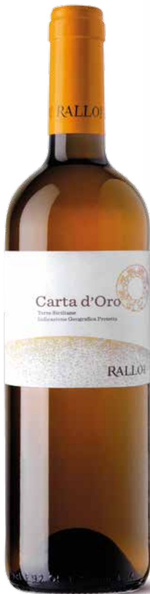
CARTA D'ORO blend di uve autoctone bianche BIO Terre Siciliane IGP/ Pattipiccolo - Alcamo