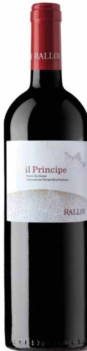
IL PRINCIPE blend di uve autoctone rosse BIO Terre Siciliane IGP/ Pattipiccolo - Alcamo