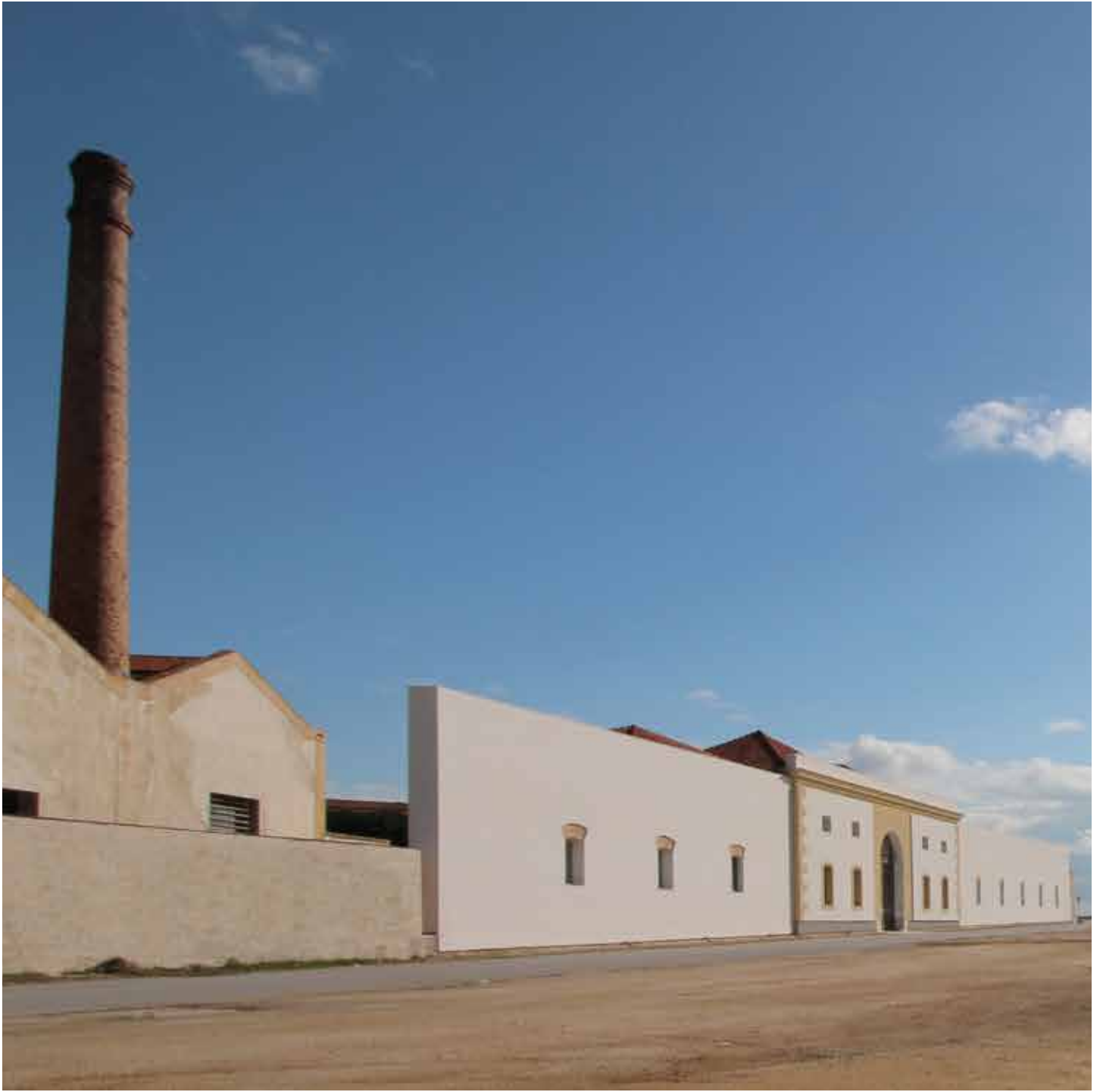
La Cantina, Marsala The winery, Marsala