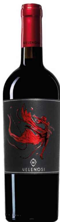
NINFA - VINO ROSSO

Varietà Vitigni: Montepulciano, Sangiovese