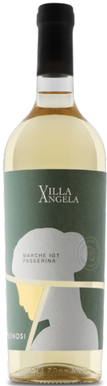
MARCHE IGT PASSERINA