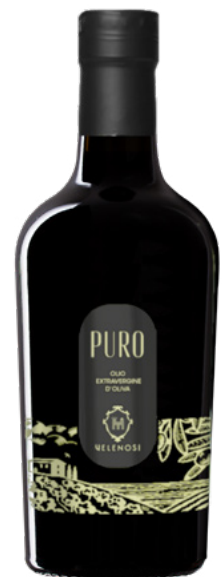
OLIO EXTRAVERGINE DI OLIVA PURO

Cultivar: Leccino, Tenera Ascolana, Frantoio