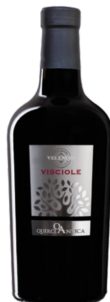
VINO E VISCIOLE - SELEZIONE

Varietà Vitigni: Lacrima, Sciroppo di Visciole Residuo zuccherino: g/l 160