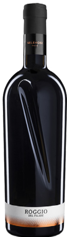
ROGGIO DEL FILARE ROSSO PICENO DOC SUPERIORE

Varietà Vitigni: Montepulciano, Sangiovese