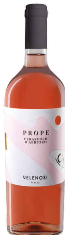
CERASUOLO D'ABRUZZO DOC