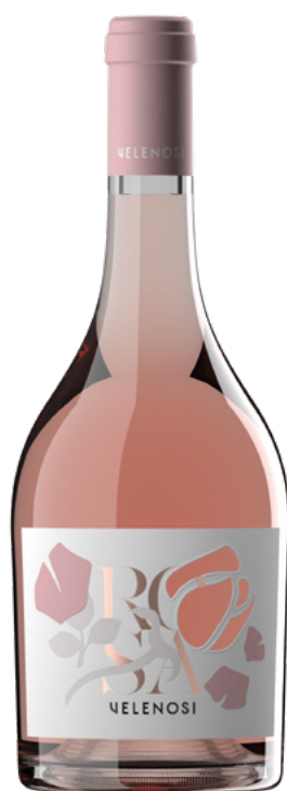
ROSA - MARCHE IGT - ROSATO

Varietà Vitigni: Trebbiano, Passerina, Pecorino