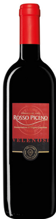
ROSSO PICENO DOC

Varietà Vitigni: Lacrima, Sciroppo di Visciole Residuo zuccherino: g/l 160