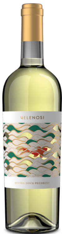
OFFIDA DOCG PECORINO