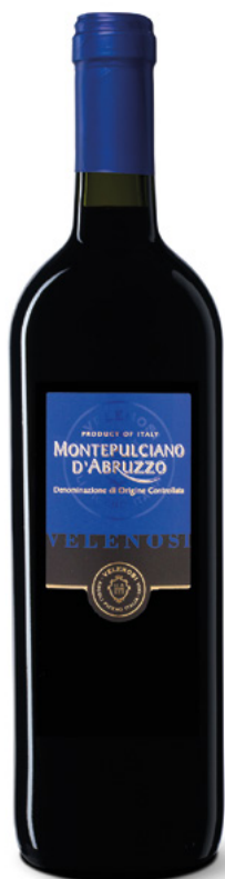
MONTEPULCIANO D'ABRUZZO DOC

Varietà Vitigni: Montepulciano d'Abruzzo 100%