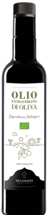
OLIO EXTRAVERGINE DI OLIVA BIO

Cultivar: Leccino, Tenera Ascolana, Frantoio