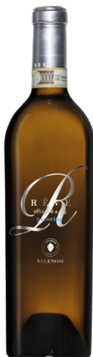
RÊVE - OFFIDA DOCG PECORINO