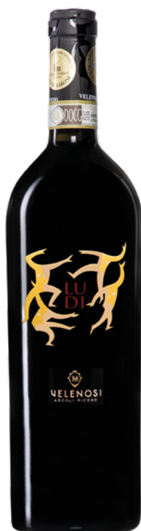
LUDI - OFFIDA DOCG ROSSO

Varietà Vitigni: Montepulciano, Sangiovese