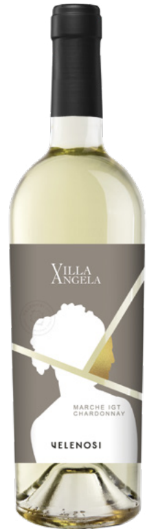
MARCHE IGT CHARDONNAY