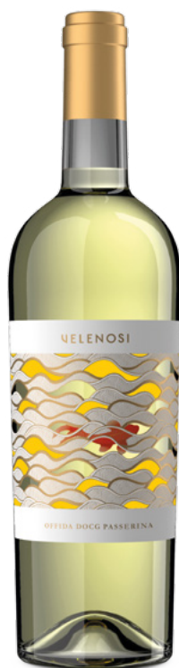
OFFIDA DOCG PASSERINA