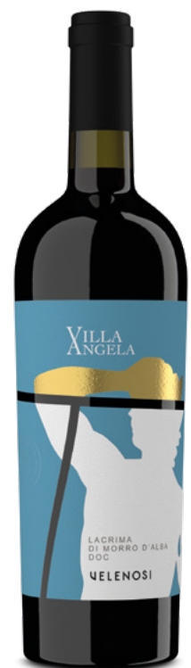
LACRIMA DI MORRO DOC

Varietà Vitigni: Lacrima di Morro d'Alba 100%