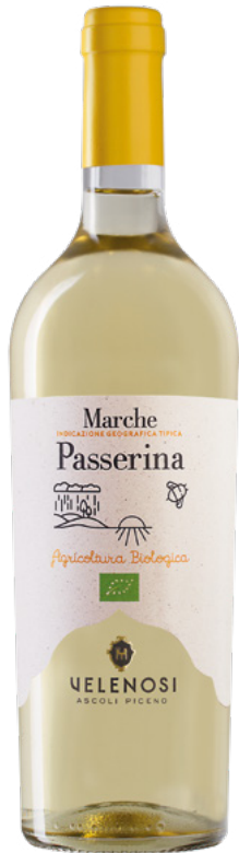
MARCHE IGT PASSERINA