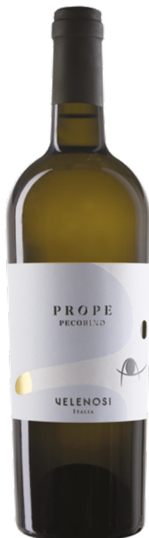
COLLI APRUTINI IGT PECORINO

Varietà Vitigni: Trebbiano d'Abruzzo 100%