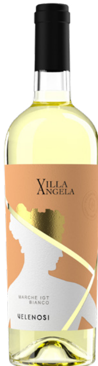
MARCHE IGT BIANCO

Varietà Vitigni: Verdicchio dei Castelli di Jesi 100%