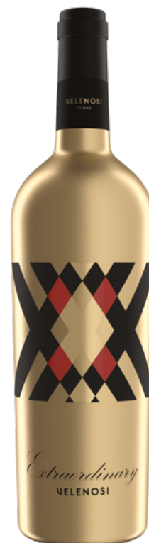
EXTRAORDINARY MARCHE IGT ROSSO

Varietà Vitigni: Montepulciano, Cabernet Sauvignon, Merlot