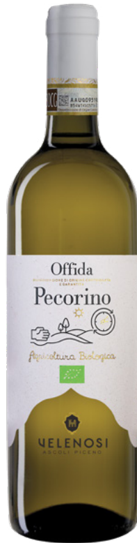
OFFIDA DOCG PECORINO