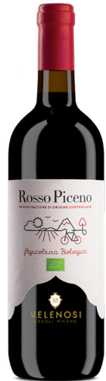
ROSSO PICENO DOC

Varietà Vitigni: Montepulciano, Sangiovese