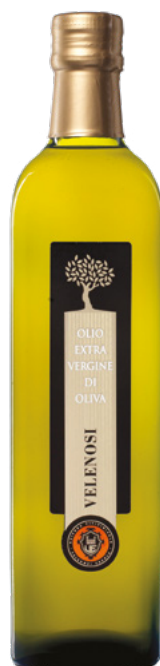
OLIO EXTRAVERGINE DI OLIVA

Cultivar: Leccino, Tenera Ascolana, Frantoio