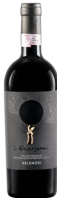
VERSO SERA COLLINE TERAMANE MONTEPULCIANO D'ABRUZZO DOCG Varietà Vitigni: Montepulciano d'Abruzzo 100%

Varietà Vitigni: Montepulciano 100% Affinato in legno grande