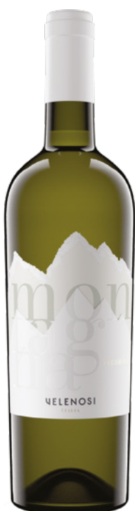
FALERIO DOC PECORINO