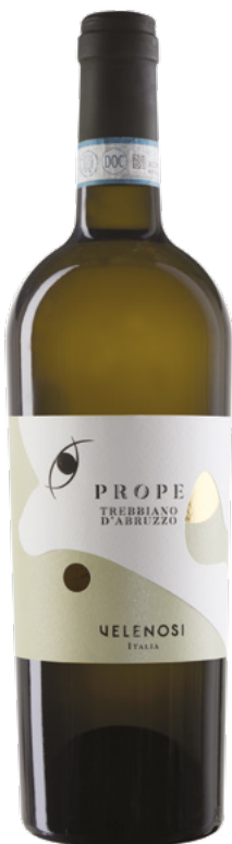
TREBBIANO D'ABRUZZO DOC

Varietà Vitigni: Trebbiano d'Abruzzo 100%