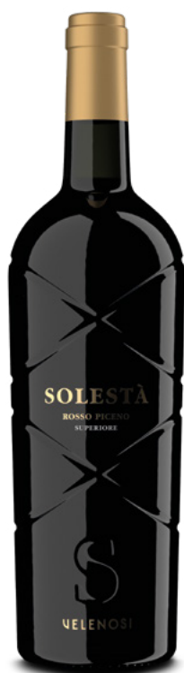
SOLESTÀ ROSSO PICENO DOC SUPERIORE

Varietà Vitigni: Sangiovese, Lacrima, Montepulciano