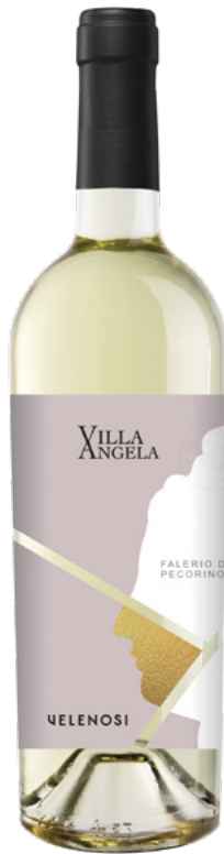
FALERIO PECORINO DOC