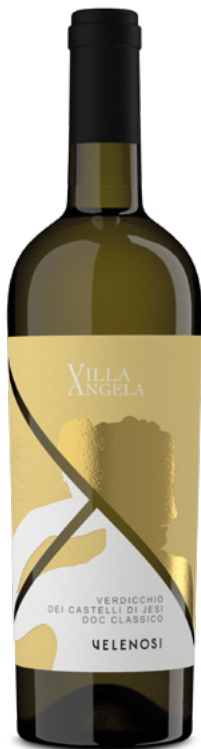
VERDICCHIO DEI CASTELLI DI JESI DOC

Varietà Vitigni: Verdicchio dei Castelli di Jesi 100%