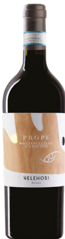
MONTEPULCIANO D'ABRUZZO DOC

Varietà Vitigni: Montepulciano d'Abruzzo 100%