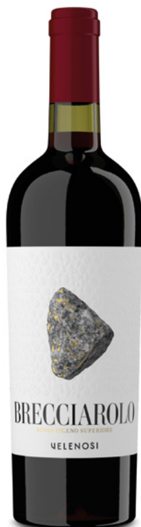
BRECCIAROLO ROSSO PICENO DOC SUPERIORE

Varietà Vitigni: Montepulciano, Sangiovese