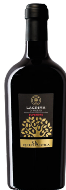
LACRIMA DI MORRO DOC SUPERIORE

Varietà Vitigni: Montepulciano, Cabernet Sauvignon, Merlot, Syrah