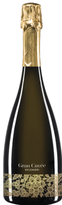
GRAN CUVÉE GOLD

Varietà Vitigni: Chardonnay, Pinot Nero Metodo Classico