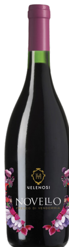
NOVELLO - MARCHE IGT

Varietà Vitigni: Montepulciano, Sangiovese